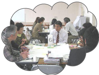
貫井町長も飛入り参加 (^ ^)ノ